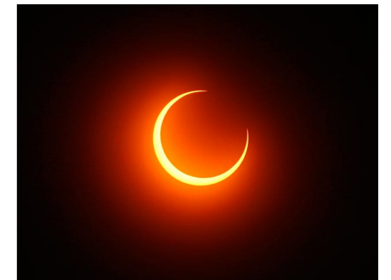
Limites de la bande de centralité