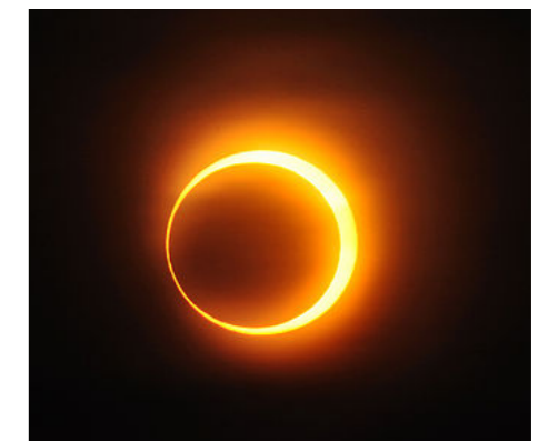
Ligne de centralité