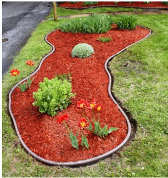
Exemple de plate-bande

Au début du printemps, un jardinier doit entretenir quatre plates-bandes : il doit les clôturer par un grillage et y semer du gazon. Dans sa remise, il lui reste 32 mètres de grillage et un sac de graines de gazon permettant d'ensemencer une surface de 50 \text{ m}^2 . Il se demande quelle plate bande il pourra entretenir entièrement avant d'aller faire des courses. Pouvez-vous l'aider?